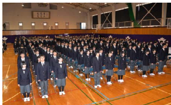
入学式 100名の新入生(40期生)