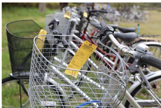
整備カードがついた自転車

にかほ市内4輪店の協力を得て4月21日(木)に 自転車安全点検 を行いました。業者の方からは「上級生の自転車に整備不良が多い。指摘箇所は必ず整備(修理)し、整備完了の状態で使用してください。」との指導をいただきました。「整備カード(黄色)」のついた自転車の持ち主の生徒は 4月28日(木)までに整備(修理) を行ってください。点検していただいた業者の皆様には大変お世話になりました。ご協力ありがとうございました。