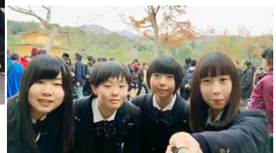
大阪城(2B)左 大阪城(2D)中 金閣寺(2A)右